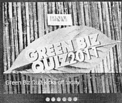
Green Biz Quiz kicks off today