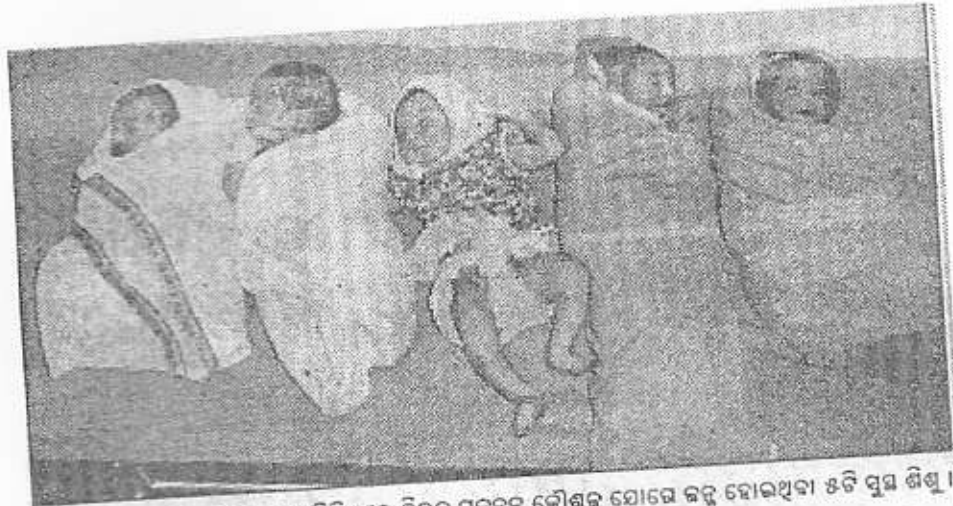
ରାଜଧାନୀ ଭୁବନେଶ୍ୱରସ୍ଥିତ ଜର ଝିନିକ୍ରେ ବିରଳ ପ୍ରଜନନ କୌଶଳ ଯୋଗେ ଜନ୍ମ ହୋଇଥିବା ଝଟି ସୁସ୍ଥ ଶିଶୁ ।

SATURDAY, AUGUST 6th, 2005 ANUPAM BHARAT