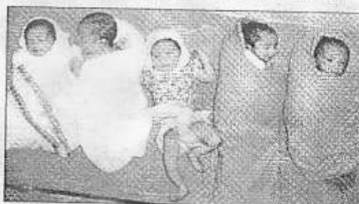
Five stars who made the clinic proud

The software used in the laser-assisted system sees the safety of the embryo and it guides the doctors/technicians so that while firing the laser ray to do the drilling on the embryo wall, there is no damage to the embryo inside, Dr Kar adds. The laser targeting software to be used in the system is so accurate that it offer a pre-firing hole size indication, image capture and advanced tools for embryo analysis. This analysis includes cell diameters, Zona Pellucida features and other statistical analysis.